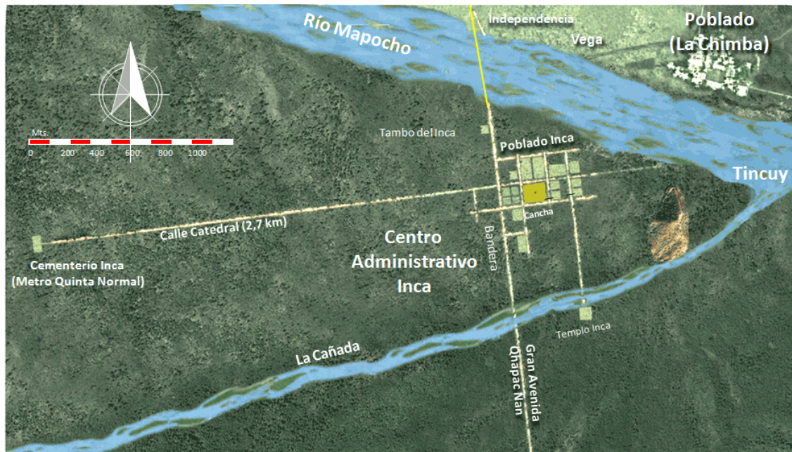
Figura 1: Centro Administrativo inca según Bustamante y Moyano