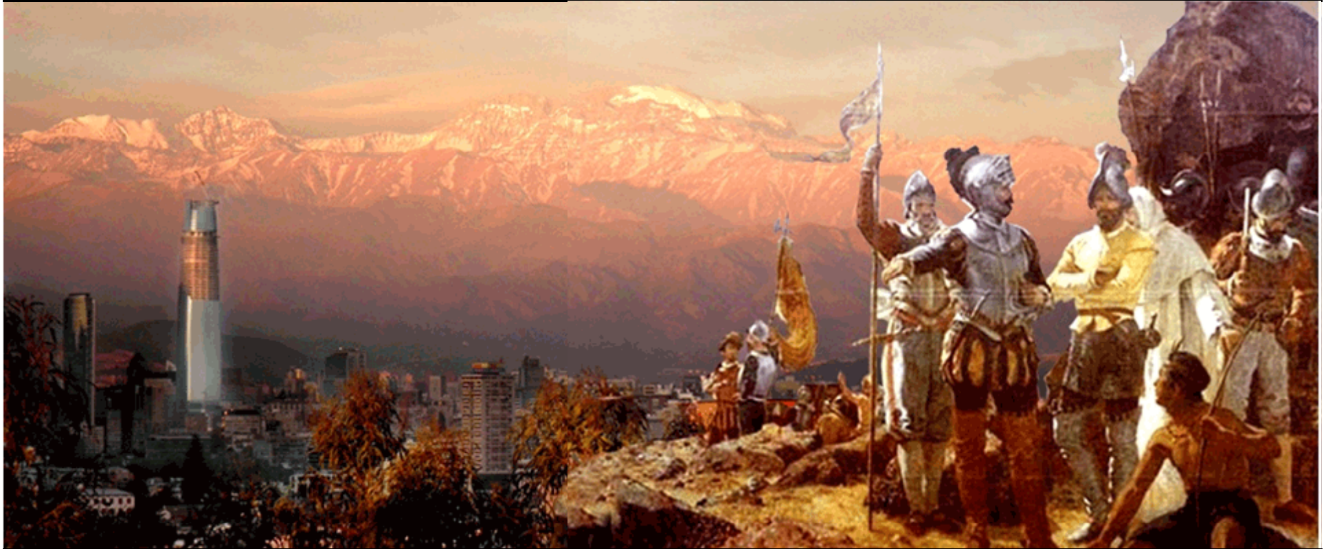
Cuadro de Pedro Lira “Fundación de Santiago” con el paisaje actual