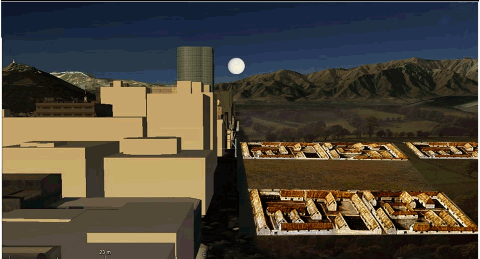
Vista aérea de calle Catedral, la luna llena y la cancha Inca